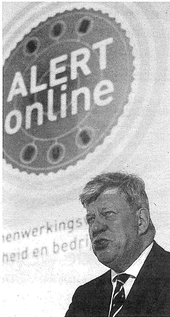
Minister Opstelten geeft de aftrap van de campagne Alert Online.

Dit jaar waren al enkele malen incidenten rond cyberveiligheid. Zo bleken websites van sommige gemeenten eenvoudig te hacken en bleken veiligheidscertificaten niet betrouwbaar. Ook konden buitenstaanders toegang krijgen tot computers van de rioolbemaling die de pompen aansturen. Het ministerie van binnenlandse zaken gaat de komende twee jaar ministeries, lokale overheden en waterschappen ondersteunen bij het versterken van hun 'weerbaarheid', zoals minister Opstelten het noemde.